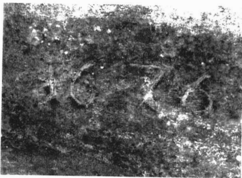
Stein in der Gartenmauer mit der historischen Jahreszahl 1676.

Krum und Augsfeld. Ab 1661 beschränkten sie sich dann anscheinend nur noch auf die Verwaltung des Schmachtenberger Klostersguts, weil von den bischöflichen Behörden in Würzburg keine Genehmigung mehr für ihren Dienst als Seelsorger erteilt wurde. Da sich wohl die Räumlichkeiten in dem 1666 erworbenen Haus als nicht ausreichend erwiesen, wurde im Jahr 1676 ein Neubau erstellt, über den sich jedoch bisher keine konkreten schriftlichen Fakten fanden. Dies dürfte zudem die einzige Baumaßnahme in dem als Propstei geltenden Ort Schmachtenberg im Auftrag des Klosters gewesen sein, wie Geldner feststellte. 13 Lediglich bei einer späteren Baumaßnahme im 20. Jahrhundert durch einen privaten Besitzer fand sich ein Eckstein mit der angegebenen Jahreszahl. Der Bauherr und Hausbesitzer ließ diesen Stein mit der Jahreszahl 1676 in die Gartenmauer vor dem neuen Haus einfügen, wo er bis dato der einzige und wichtigste Zeuge der baulichen Veränderung ist.