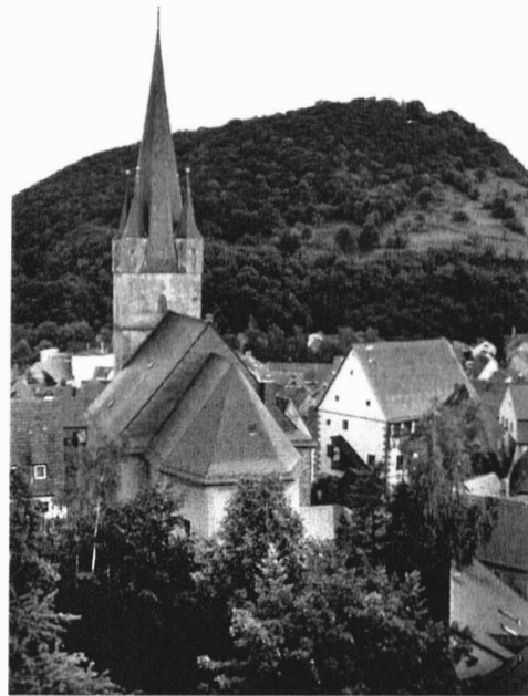
Blick vom Zeiler Stadtturm auf die Zeiler Pfarrkirche mit dem vergrößerten Kirchenschiff.

Der Baubeginn war 1713 und die Fertigstellung des Neubaus war 1715. Da jedoch nach wie vor die Finanzierung äußerst knapp ausgefallen war, konnte aus Geldmangel erst im Jahr 1732 die nötige Innenausstattung beschafft werden und eine offizielle Einweihung am 9. September dieses Jahres erfolgen.